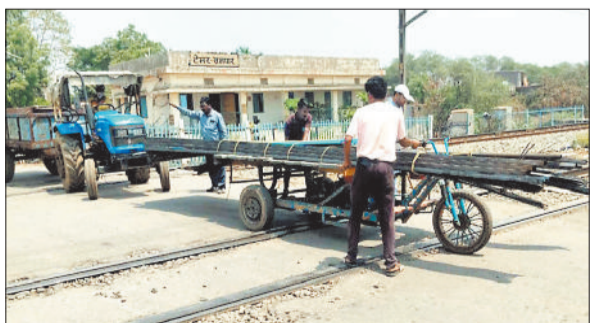
फाटक के बीच बने गड्ढे में फंसा सरिया लोड वाहन।

अडभार-सक्ती मार्ग में ग्राम पंचायत सोती से होकर मुंबई हावड़ा रेल लाइन गुजरता है, जहां पर ट्रेन समपार के नाम से रेलवे क्रॉसिंग है। यहां पर देखने में आ रहा है कि फाटक के बीच में कई जगह खतरनाक गड्ढे बन गए हैं, जिसके कारण रेल फाटक खुलने के बाद दो पहिया, चार पहिया वाहनों के चक्के इन गड्ढों में फंस जा रहे हैं, जिसके कारण आपाधापी में रोज एक दूसरे वाहनों से टकरा जा रहे हैं तो कई बरस समान लगे वहां भी इन गड्ढों में फंस जा रहे हैं, जिससे भारी