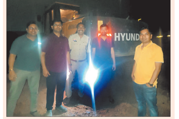
छापेमारी कर वाहनों की जब्ती करती संयुक्त टीम।

कर पुलिस लाइन खोरखा में सुरक्षार्थ रखा गया है। खनिज के अवैध परिवहन के दर्ज प्रकरणों पर अवैध परिवहनकर्ताओं के विरुद्ध खान एवं खनिज (विकास एवं विनियमन) अधिनियम 1957 की धारा 21 से 23 (ख) के तहत दंडात्मक कार्यवाही की जाएगी।