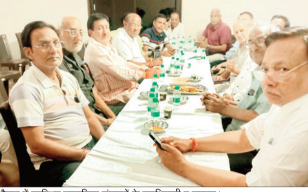
बैठक में उपस्थित सामाजिक संगठनों के पदाधिकारी व सदस्य।

रेल सुविधाओं के मामले में लगातार उपेक्षित कोरबा के लोग हक की लड़ाई के लिए अब एक मंच के साथ आगे बढ़ने की तैयारी कर लिए हैं। मंगलवार को श्री अग्रसेन भवन कोरबा में बैठक आयोजित की गई। बैठक में रेल प्रशासन द्वारा कोरबा की उपेक्षा किए जाने को लेकर चर्चा के बाद निर्णय लिया गया कि रेल सुविधाओं की मांग को लेकर चरणबद्ध आंदोलन किया जाएगा। बैठक में उपस्थित जनों ने सुझाव दिये कि सर्वप्रथम कोरबा में रेलवे से जुड़ी समस्याओं की सूची बनाकर मंत्री, सांसद, विधायक एवं कलेक्टर को दी जाए और उनसे यह आग्रह किया जाए कि समस्याओं के निराकरण में वे अपने स्तर पर योगदान दें। इस हेतु जल्द ही एक प्रतिनिधि मंडल बनाए जाने का भी निर्णय लिया गया। जो जनप्रतिनिधि एवं प्रशासनिक अधिकारियों से मिलकर अपनी कोरबा रेल विकास समिति के नेतृत्व में आगे की रणनीति बनाकर चरणबद्ध तरीके से प्रयास करने का निर्णय लिया गया। बैठक में उपस्थित नगर के प्रमुखजनों ने सुझाव दिए कि किस तरह हम रेल प्रबंधन में