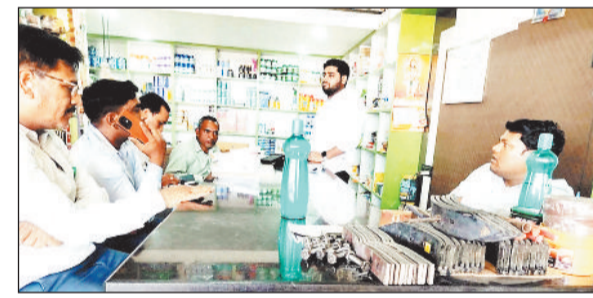
दुकान में निरीक्षण कर जांच करती टीम।