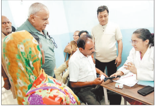
शिविर में मरीजों की जांच करते चिकित्सक।