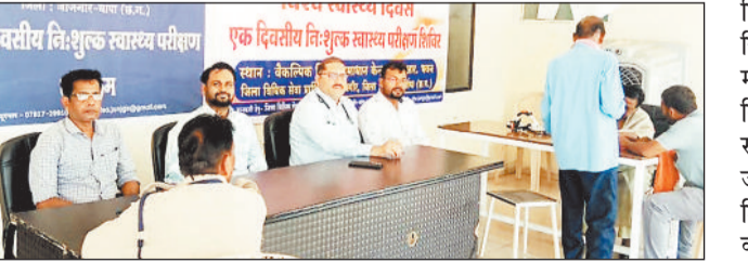
शिविर में मंत्रय अतिथिगण एवं उपचार करते लोग।

विश्व स्वास्थ्य दिवस के अवसर पर जिला विधिक सेवा प्राधिकरण जांजगीर में निःशुल्क स्वास्थ्य परीक्षण शिविर का आयोजन हुआ। इस दौरान आम लोगों को शारीरिक और मानसिक स्वास्थ्य के प्रति जागरूक किया गया।