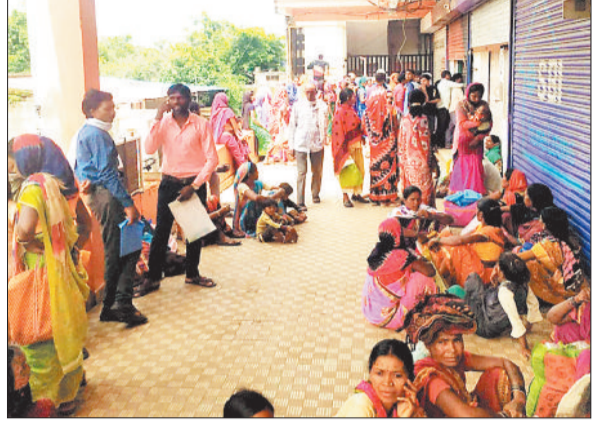
बैंक के सामने जुटी महिलाओं की भीड़।

राज्य सरकार की महतारी वंदन योजना के तहत लाभ पानी वाली महिलाओं का ई-केवाईसी अनिवार्य कर दिया गया है। ऐसे में तपती दोपहरी में ई-केवाईसी कराने महिलाओं की भीड़ जुट रही है। सुबह से शाम तक बैंक और चवाईसी सेंटरों में मशक्कत शुरू हो गई है। गौरतलब है कि महतारी वंदन योजना के तहत निर्धारित पात्रता रखने वाली जिले की 2 लाख 91 हजार महिलाओं की पात्रता के अनुसार हर महीने 1 हजार एवं सालाना 12 हजार रुपए की राशि शासन के द्वारा उनके बैंक खातों में जमा कर दी जाती है। इस राशि के माध्यम से महिलाएं अपने जरूरत की सामानों की खरीदी कर सके इसके लिए उनके बैंक खातों का ई-केवाईसी अपडेट करना जरूरी है। राज्य शासन की आदेश के अनुसार 1 अप्रैल से 30 जून के बीच बैंक खातों के ई-केवाईसी का काम कराया जाना है। इसे लेकर महिलाओं की नजर आ रही है। भारतीय स्टेट बैंक, बैंक ऑफ़ बड़ोदा, पंजाब नेशनल बैंक, एचडीएफसी बैंक देना बैंक बैंक ऑफ़ इंडिया बैंक ऑफ़ महाराष्ट्र समेत छत्तीसगढ़ ग्रामीण बैंक एवं जिला सहकारी बैंकों में भी ई