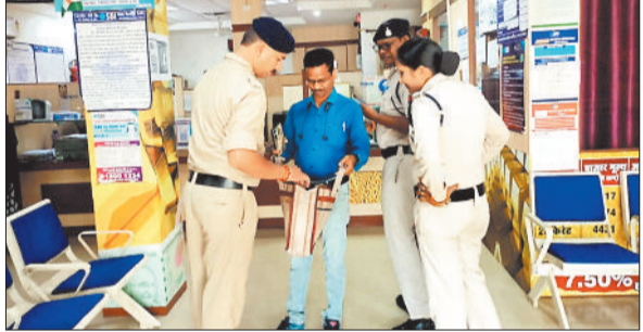
बैंक में सुरक्षा की जांच करती पुलिस की टीम।

कर पुलिस लाइन खोरखा में सुरक्षार्थ रखा गया है। खनिज के अवैध परिवहन के दर्ज प्रकरणों पर अवैध परिवहनकर्ताओं के विरुद्ध खान एवं खनिज (विकास एवं विनियमन) अधिनियम 1957 की धारा 21 से 23 (ख) के तहत दंडात्मक कार्यवाही की जाएगी।